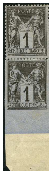
Non dentelés accidentels tenant à dentelés