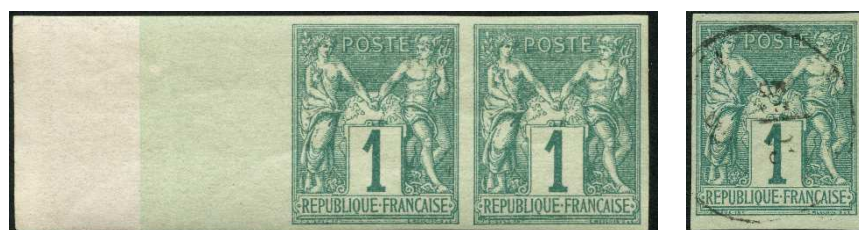
France ou Colonies ?

Est-il normal que le 1 c non dentelé de France n° 61, cote 175 euros, et que la même valeur non dentelées des colonies n°24, cote 30 euros alors qu'il est quasi impossible de les différencier, le timbre de France étant issu de la première partie du tirage et celui des colonies de la seconde partie ?