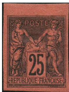
France cote 900 €