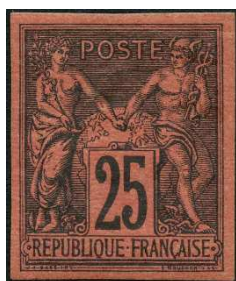
Colonies cote 700 €