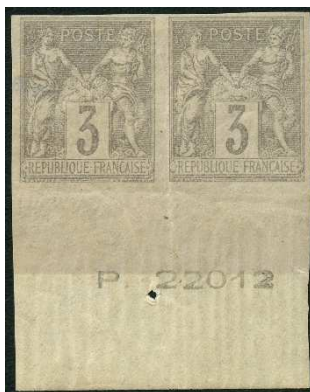
Non dentelé accidentel, les inscriptions marginales sont postérieures à 1881 l'année d'émission.

Il existe des non dentelés accidentels, que trop souvent des collectionneurs béotiens ont séparés des exemplaires dentelés.