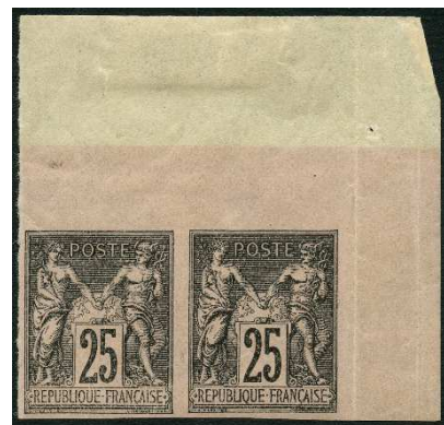
Non dentelé destiné aux collections officielles