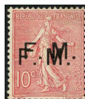
Double surcharge fausse