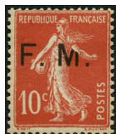
Surcharge renversée M cassé