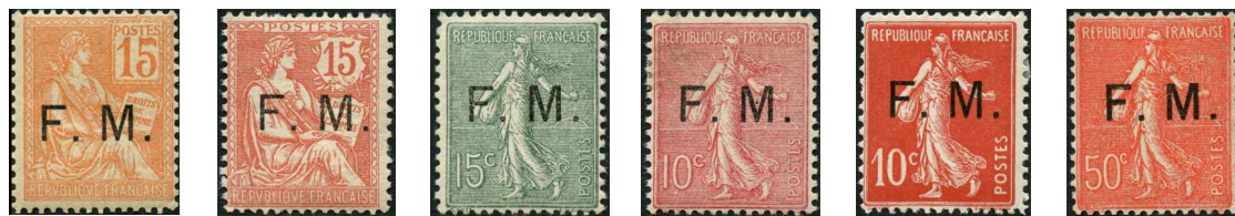
Tableau des timbres surchargés

Les falsifications des doubles surcharges sont de deux sortes. Soit les deux surcharges sont fausses, cas le plus fréquent, soit une seule des surcharge est fausse. Dans ce cas il est facile de déceler le truquage, les deux surcharges étant différentes d'aspect.