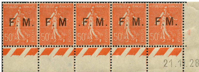
sans • après M • avant F