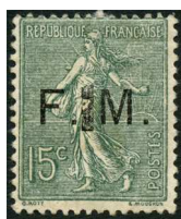
Trait avant M