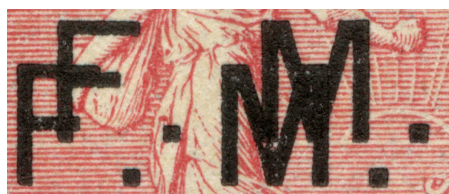
Deux surcharges fausses

Ce ne sont que des exemples de falsifications, mais il est facile de comparer une surcharge renversée avec une surcharge droite authentique